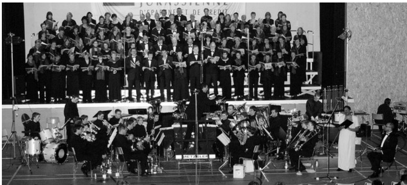
L'ensemble de cuivres jurassien, l'ensemble vocal jurassien et le chœur Vivaldi lors du premier concert destiné aux sponsors dans la nouvelle Halle des fêtes de Glovelier.

Après le succès de Carmina Burana puis des Tableaux d'une Exposition, l'ECJ s'est à nouveau imposé un défi original. Ecrit par Georges Gershwin, musicien américain d'origine russe, Porgy and Bess a été arrangé pour l'occasion par Olivier Chabloz, qui était déjà l'auteur de l'arrangement pour chœur et Brass Band de Carmina Burana.