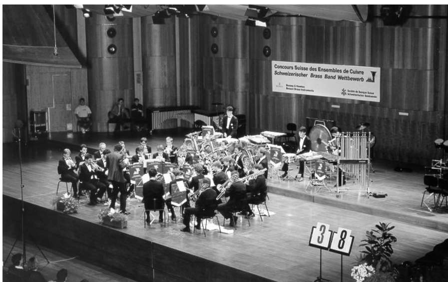
L'ensemble de cuivres jurassien en production à Montreux, en 1993, lors de sa première année d'existence.

Parler des dix ans de l'E.C.J. quand on en fait partie depuis le début est une chose difficile , vous vous en doutez. Mais vous ne savez certainement pas ce qui crée ces difficultés. Nous allons essayer de vous éclaircir le sujet.