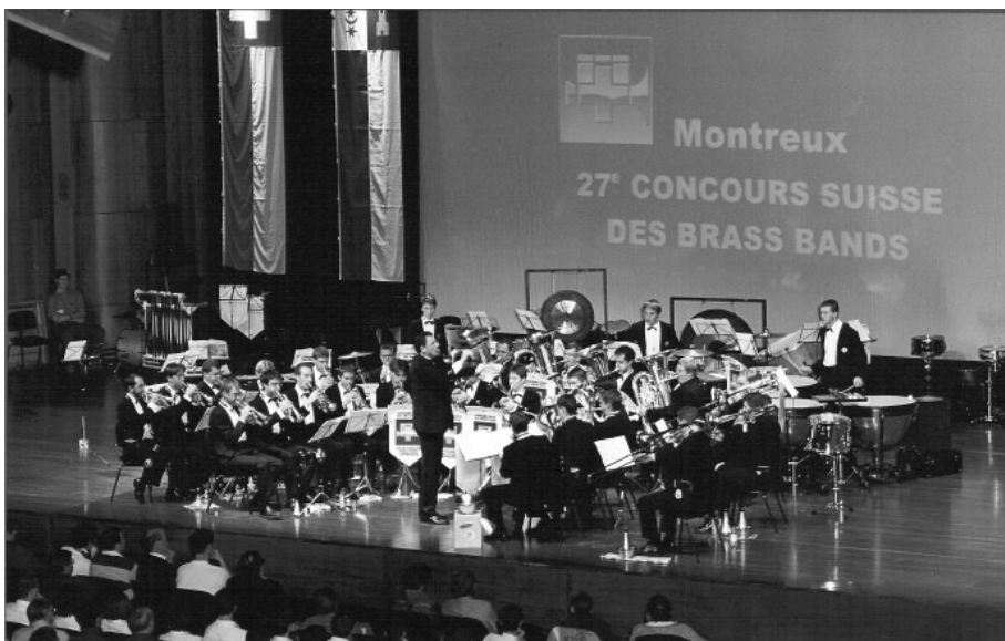
L'ensemble de cuivres jurassien à Montreux, 8 ans après sa création !