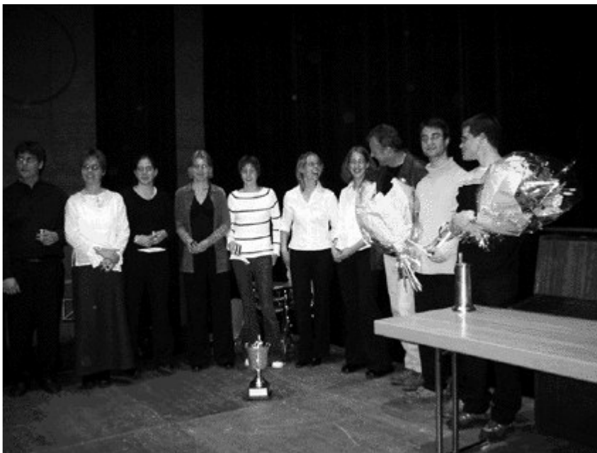
Les lauréats du 16 ème concours jurassien des solistes et ensemble (Fontenais 2003).