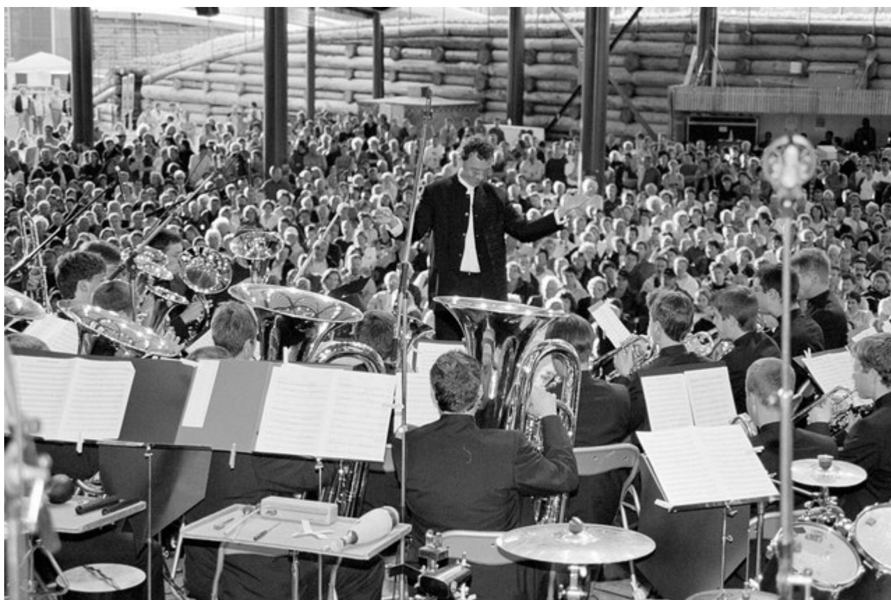
Le nombreux public venu écouter l'ensemble de cuivres jurassien et l'ensemble vocal jurassien sur l'artéplage d'Yverdon en juillet 2002