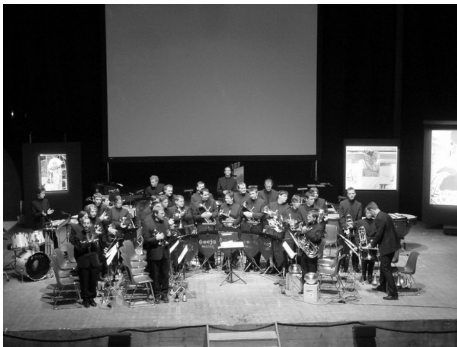
Les tableaux d'une exposition de Modest Moussorsky à l'artéplage de Morat

Pour en savoir encore plus sur les activités de l'ECJ, n'hésitez pas à consulter notre site internet, www.ecj.ch . Vous y trouverez des infos, des photos, des coupures de presse, des extraits audio et même des vidéos de nos différents concerts. Vous pouvez également y découvrir la formation 2003, profondément remaniée.