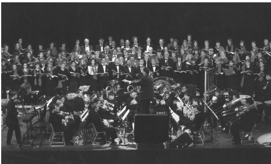
L'ensemble de cuivres jurassien et l'ensemble vocal jurassien en action sur l'arteplage d'Yverdon

Le deuxième point culminant de cette année 2002 fût la présentation des tableaux d'une exposition de Modest Moussorsky, accompagnée par un film montrant les particularités du Jura, et par des oeuvres artistiques, toutes réalisées par des artistes jurassiens (pour plus d'informations, consultez les anciens ECJ-info et le site www.lestableaux.ch , des photos des oeuvres, des extraits de films, ainsi que des informations sur les artistes et les cinéastes y sont disponibles). L'ECJ a interprété à 5 reprises (3 fois à l'arteplage de Morat, 2 fois à la halle des expositions à Delémont) cette oeuvre classique devant un public épâté par la qualité musicale et